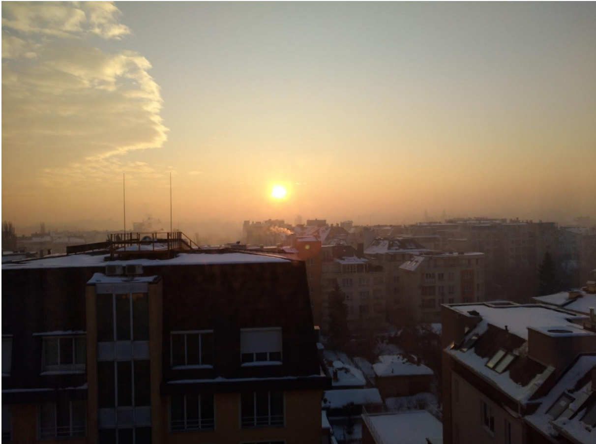
Снимка: Смог в кв. Павлово

Всички заедно дишаме отрова! Нека заедно да започнем промяна! Питайте ни за мръсния въздух, за вредите от него, и как можете да се предпазите. Ние ще ви отговоряме! Ако пък искате да споделите нещо или горите да отговорите вместо нас, тогава моля, думата е ваша!